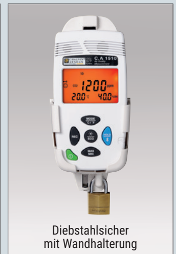
Diebstahlsicher mit Wandhalterung