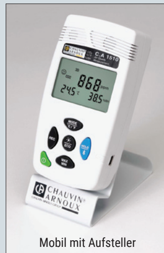
Mobil mit Aufsteller